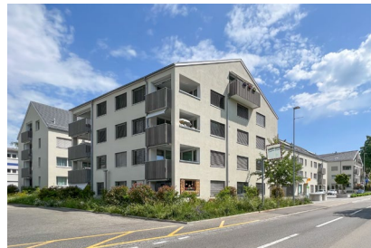
Bahnhofstrasse - Fahrwangen