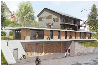
Hofberg - Wil