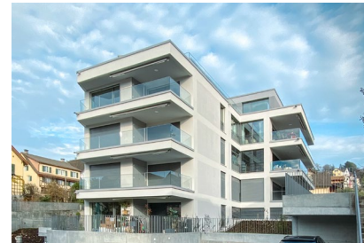
Alte Landstrasse - Küsnacht