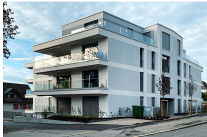
Alte Landstrasse - Küsnacht