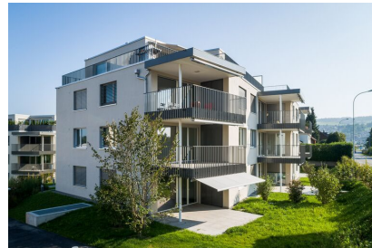
Sandäcker - Rottenschwil