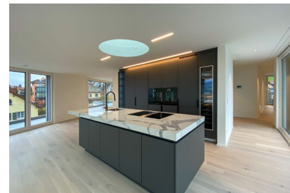
Alte Landstrasse - Küsnacht