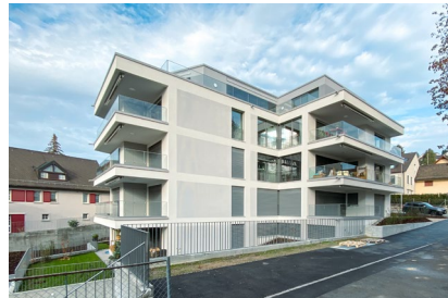
Alte Landstrasse - Küsnacht