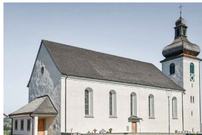
Katholische Kirche - Hemberg