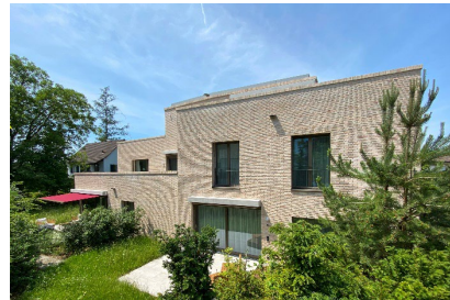
Terrazza - Küsnacht