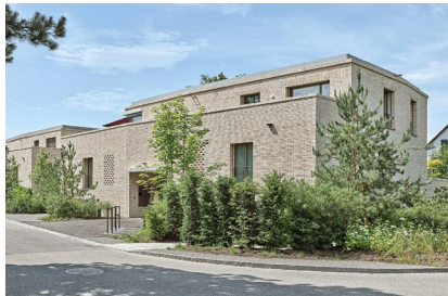
Terrazza - Küsnacht