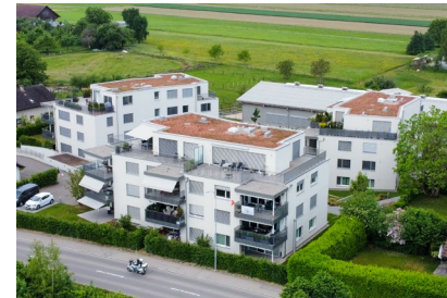
Sandäcker - Rottenschwil