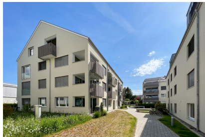
Bahnhofstrasse - Fahrwangen