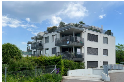
Sandäcker - Rottenschwil