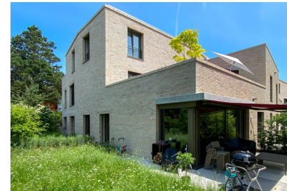
Terrazza - Küsnacht