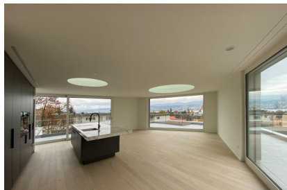
Alte Landstrasse - Küsnacht