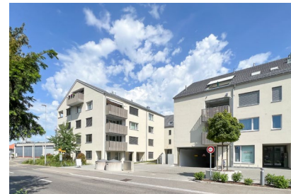
Bahnhofstrasse - Fahrwangen